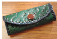
出来上がった作品